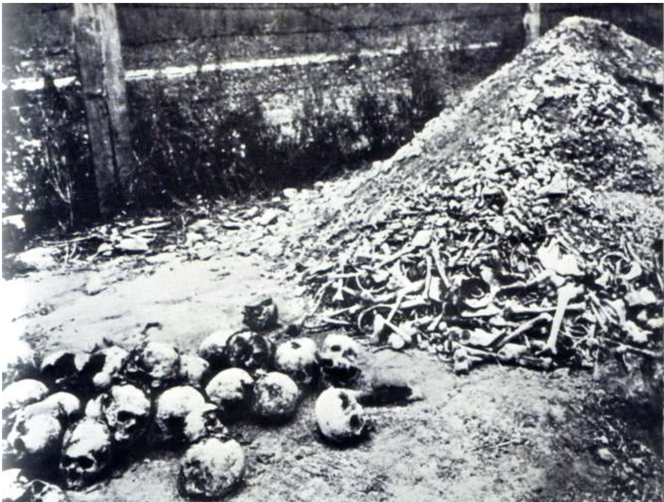
Один из концентрационных фашистских лагерей: это были люди...