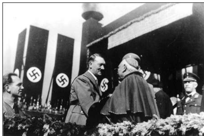
Гитлер приветствует католического кардинала.

Большим опытом использования национально-религиозных конфликтов для раскола многонациональных государств обладали гитлеровские спецслужбы.