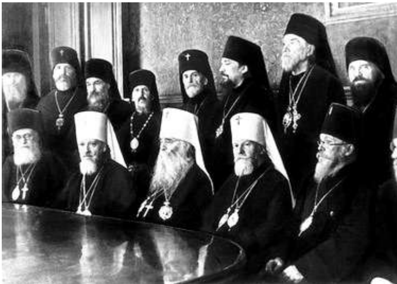
Заседание Архиерейского Собора РПЦ (8 сентября 1943, Москва).