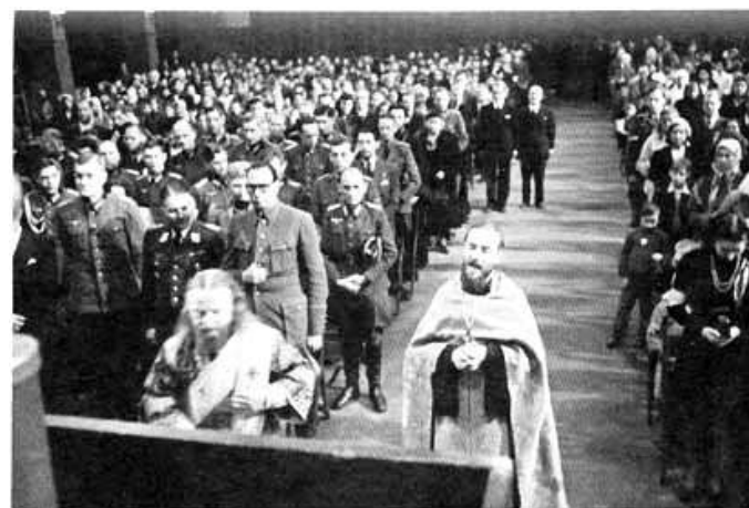
Молебен РОА. В первом ряду - генерал Власов.