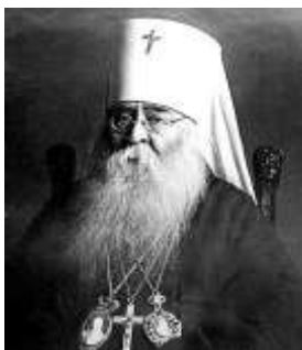
Митрополит Сергей (Страгородский)