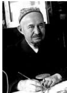
Муфтий Габдрахман Расулев