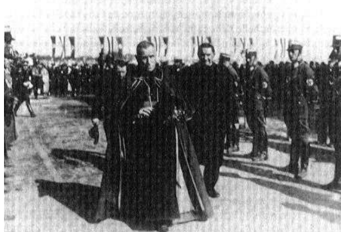
Кардинал Михаэль Фаульхабер марширует с нацистами.