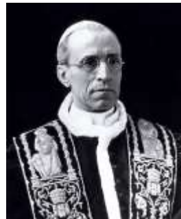
Папа Пий XII