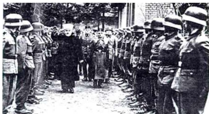
Муфтий аль-Хуссейни приветствует солдат 13-й гитлеровской исламской дивизии Ханзар.