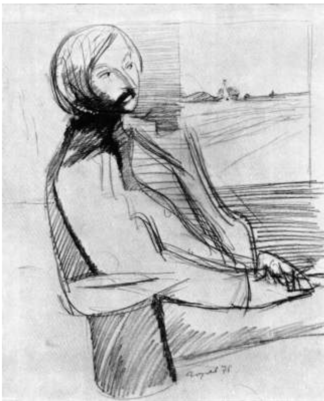
В.Н. Горяев. Портрет Н.В. Гоголя. 1976